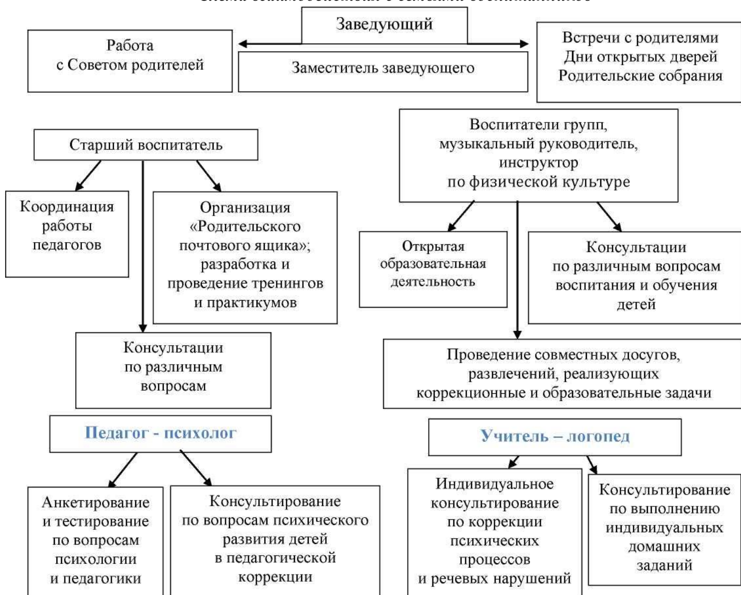
Рис. 1 «Схема взаимодействия с семьями воспитанников»